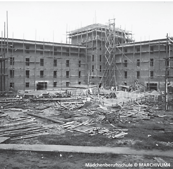
Mädchenberufsschule © MARCHIVUM4

Fabrikarbeit in Oggersheim Führung durch eine erstaunliche Ausstellung Freitag, 9. 5. 2025, 17:00 Uhr