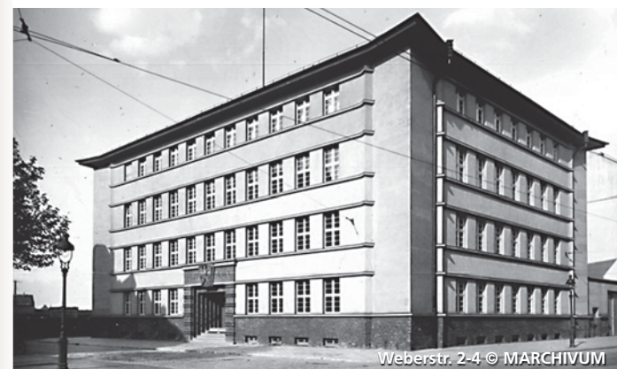
Weberstr. 2-4

„Bauhaus-Kirche“ in der Neckarstadt Soziale Umbrüche und zerrissene Lebenswelten Donnerstag, 20. 2. 2025, 16:00 Uhr