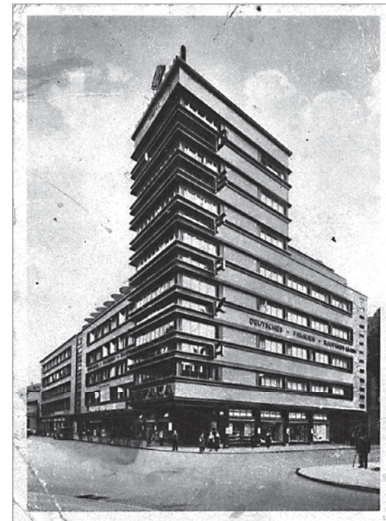
Turmhaus N7